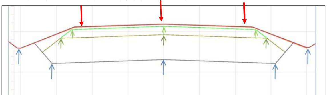
Kuva 1 Leikkauspohja ja kerrosrakenteet